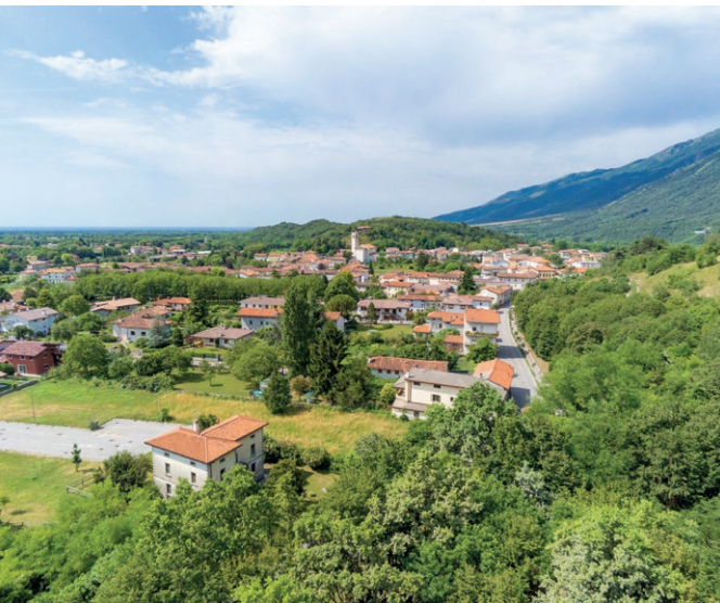
Panoramica di Montereale Valcellina.