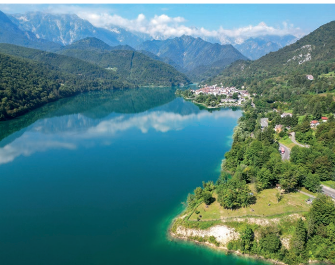
Lago di Barcis.