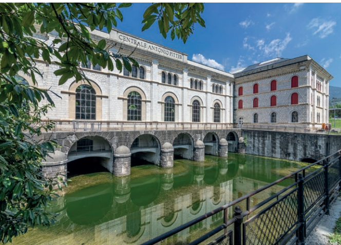
Centrale idroelettrica Antonio Pitter a Malnisio.