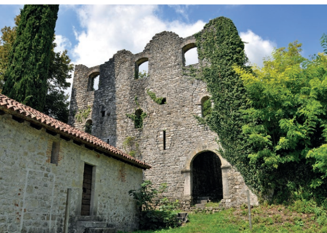
Il castello di Maniago