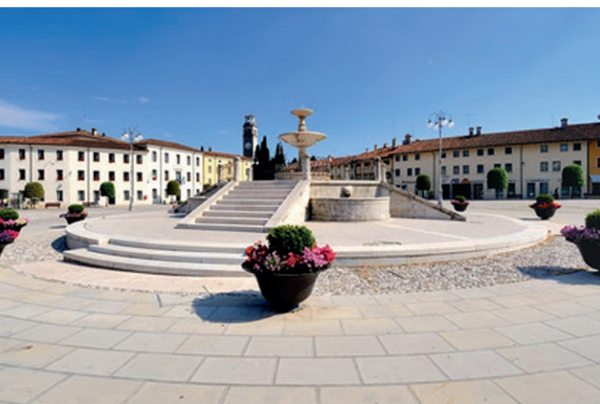
Maniago, Piazza Italia