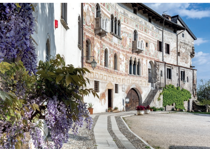
Il castello di Spilimbergo.